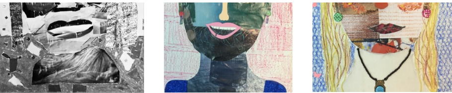
Collages realizados por estudiantes del Grado en Maestro en Educación Infantil (2014-15)